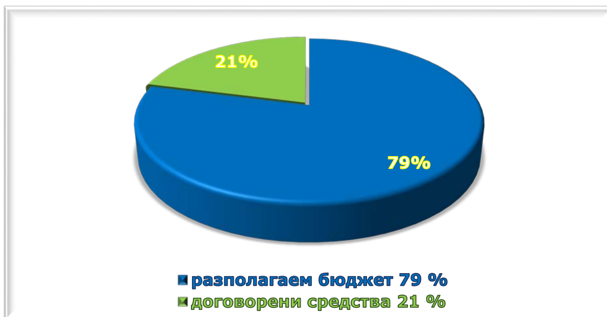
Фигура 2. Дял на договорените средства от бюджета на ОП НОИР